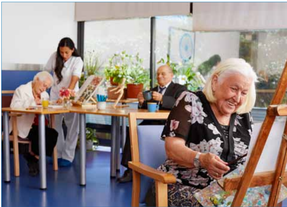
La pintura es una terapia no farmacológica que desarrolla la creatividad de los mayores.

Las personas mayores, más sensibles a los efectos de ciertos fármacos, acceden a opciones terapéuticas idóneas