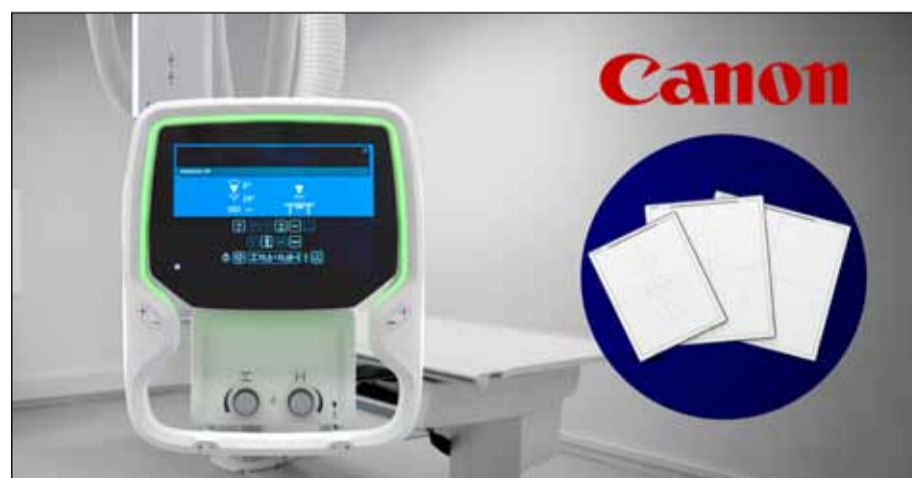
Sala Radiología Aceso+ con detectores CXDI ELITE.

Debido a esto, es necesario que quede registrado en el historial del paciente la radiación que se ha recibido en todas las pruebas de radiología en un formato oficial y estándar, denominado Reporte Estructurado de Dosis (SRDR). En los equipos de radiología simple, localizados en el servicio de radiodiagnóstico, esta es una labor más sencilla no solo porque cuentan con dispositivos medidores de dosis (DAP)