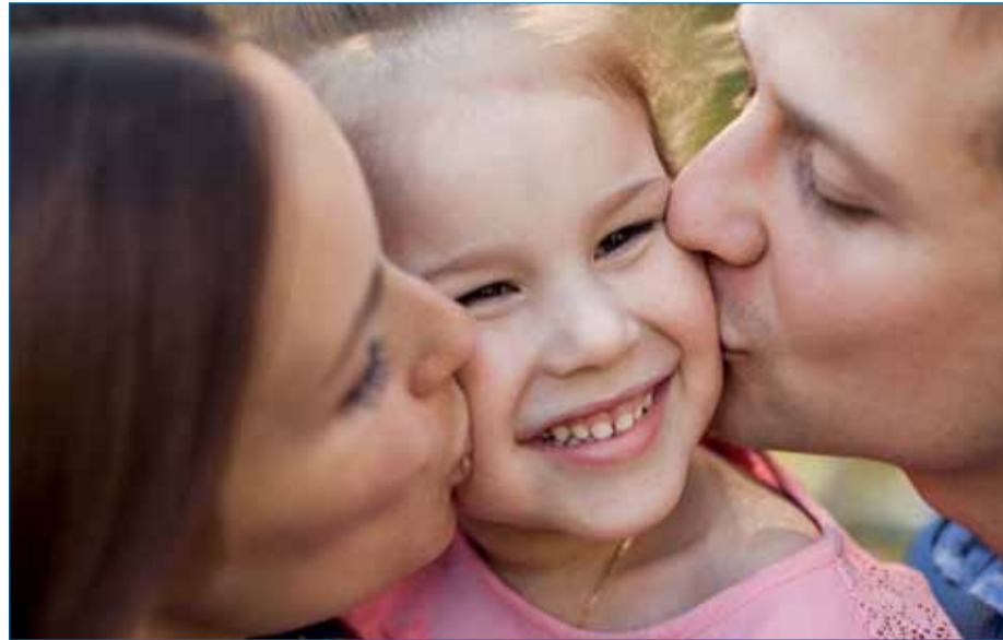
Los enfermos de Fabry pueden presentar los primeros síntomas desde la infancia.