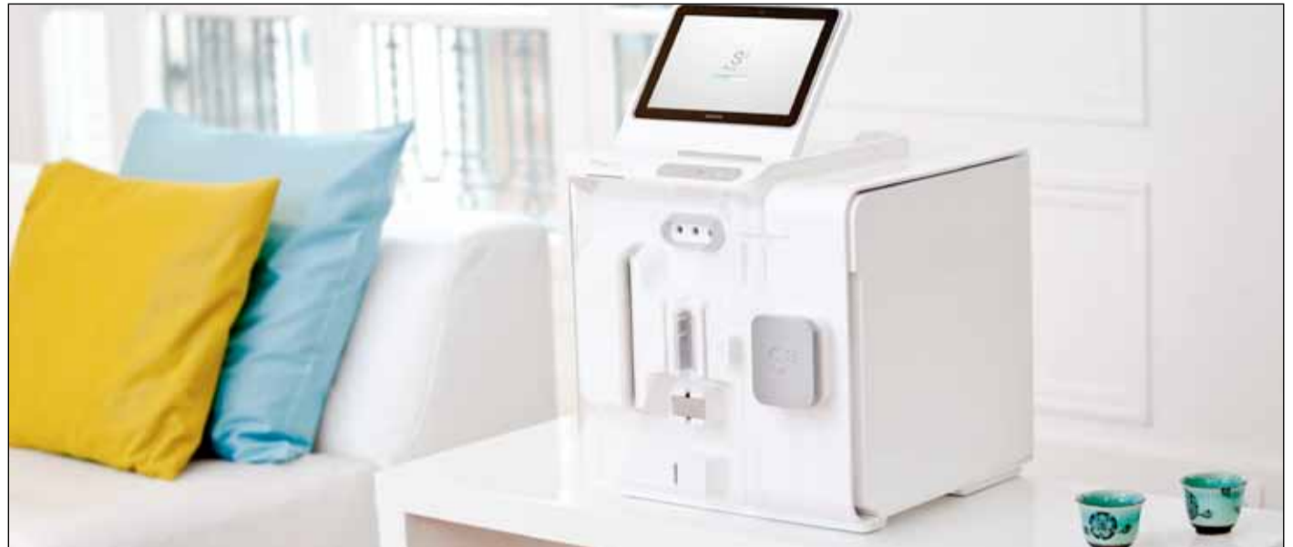
Los dispositivos de uso doméstico son más compactos y fáciles de usar.