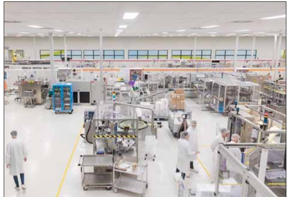
Interior de la fábrica de vacunas de GSK en Wavre (Bélgica), la más grande del mundo.

Además, los profesionales sanitarios, la primera línea en caso de brotes, han de ser ejemplo. Un estudio elaborado por la Comisión Europea sobre el estado de la confianza en las vacunas en la UE señala