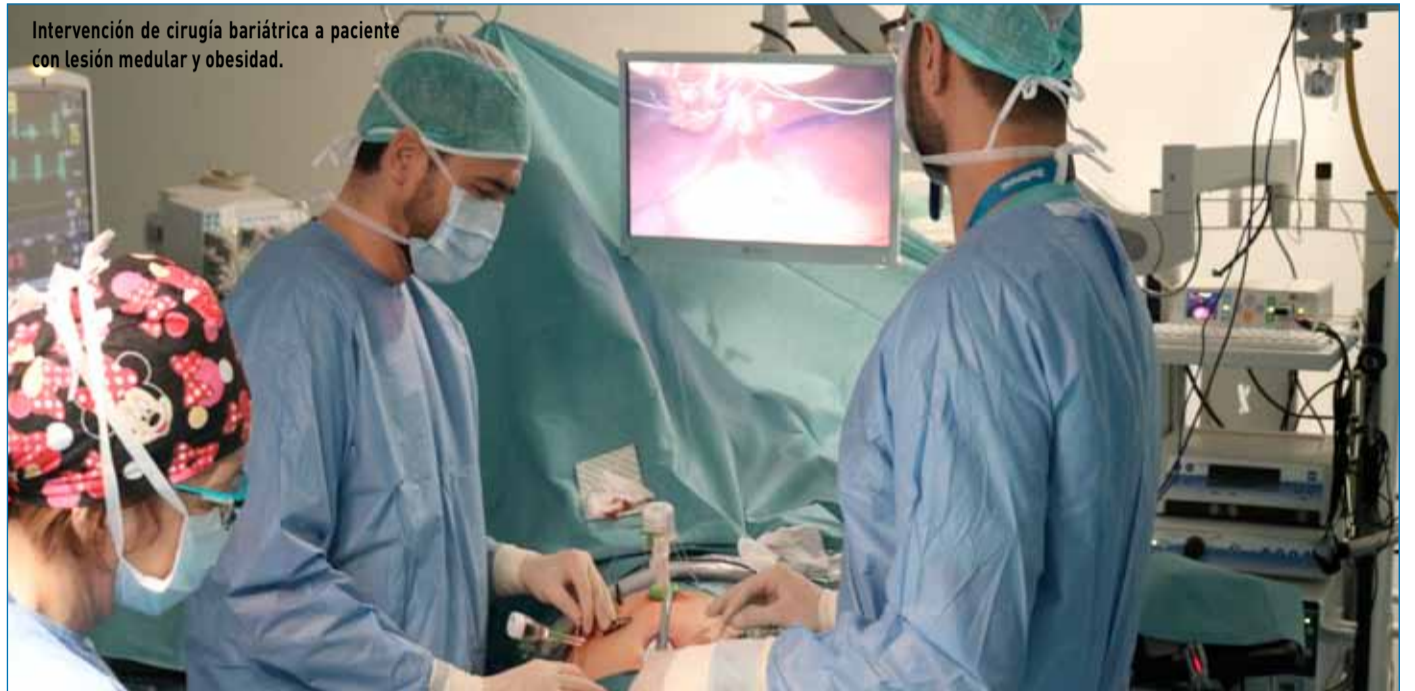
Intervención de cirugía bariátrica a paciente con lesión medular y obesidad.

vida. Esto se refleja, según los pacientes, en una mayor facilidad en las transferencias de la silla a otros espacios, en la realización de sus actividades cotidianas y en la práctica de actividad física. Desde este centro subrayan que este programa ha impulsado