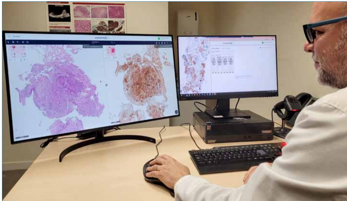
La imagen digital mejora el rendimiento de los patólogos y los flujos de trabajo.

Se trata de un salto cualitativo en varios ámbitos del flujo de trabajo. Por un lado se obtiene una visualización de las preparaciones anatomopatológicas en una pantalla de alta resolución que consigue disponer de una réplica exacta de la muestra de tejido para que pueda ser analizada informáticamente. La altísima calidad de imagen facilita la realización de mediciones, anotaciones sobre la muestra, conteo y coloreado de células o de zonas, etcétera. Este sistema posibilita también la sincronización de varias muestras en la pantalla, permitiendo su análisis comparativo. Las imágenes digitales se conservan de forma ordenada y segura en un repositorio central,