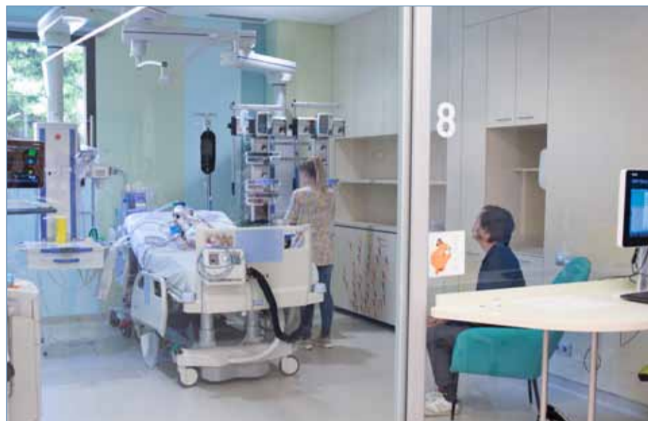
UCI pediátrica del Hospital Sant Joan de Déu de Barcelona.

La sepsis puede adquirirse por una infección contraída en la comunidad, a partir de una pulmonía, de una infección urinaria o de una meningitis. "En estos casos, las UCIs de pediatría no podemos hacer nada para prevenirla, solo podemos tratarla. Y existe un porcentaje bajo