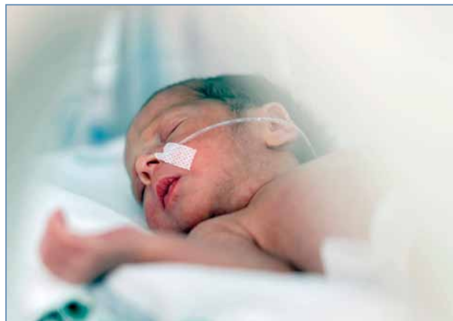
El nacimiento antes de tiempo del bebé interrumpe el adecuado desarrollo.

tienen hasta los seis meses de edad, en los que tiene síndrome de Down, sufren enfermedades neuromusculares concomitantes o cardiopatías congénitas. "Además, existen factores de riesgo favorecedores de la enfermedad como situaciones de hacinamiento, hermanos mayores en edad escolar o el tabaquismo parental", apunta este especialista.