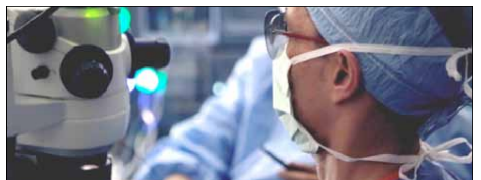
La cirugía oftalmológica está en constante evolución.

debatido las novedades en cirugía de polo posterior, cirugía de catarata y la importancia de la formación de especialistas para hacer frente a los retos del presente y el futuro de la salud ocular. Entre otros temas, la importante evolución que ha experimentado la cirugía de vítreo-retina con la incorporación de tecnologías disruptivas y herramientas de alta precisión, como las sondas de vitrectomía de bajo calibre o los sistemas de visualización 3D. “Las ventajas de este tipo de tecnologías son tantas que probablemente en el futuro estaremos trabajando con 3D en la mayoría de los casos. Estas técnicas hacen que se necesite mucha menos luz para trabajar dentro del ojo, disminuyendo la fototoxicidad, además de ofrecer una gran profundidad de foco y un gran sentido de la estereopsis”, explica el Profesor José García Arumí, presidente de la Sociedad Española de Retina y Vítreo (SERV) y especialista en Retina del Instituto de Microcirugía Ocular (IMO).