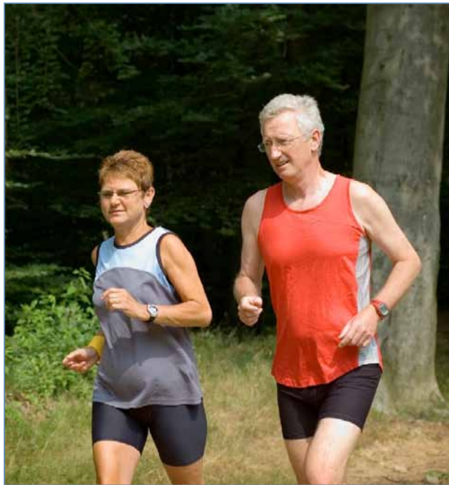
El abordaje del nivel óseo, muscular y articular es fundamental a partir de los 50.

Así, aunque es posible ralentizar los efectos del proceso de envejecimiento y sus consecuencias, gracias a la adopción de hábitos saludables, como la realización de ejercicio físico moderado y una dieta adecuada, el ritmo de vida actual y las exigencias profesionales y personales obstaculizan que los aportes nutritivos sean óptimos, por lo que en ocasiones es recomendable la suplementación nutricional. Los suplementos dietéticos proporcionan al organismo nutrientes para paliar las molestias que afectan a la capacidad de movimiento. Desde Nestlé Health Science señalan que es fundamental abordar los problemas de movilidad simultáneamente en sus tres pilares implicados: articulaciones, músculos y huesos. En esta triple actuación,