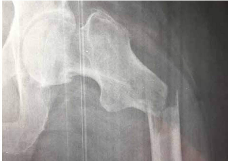
El tratamiento de la metástasis ósea se centra en reducir el dolor y evitar fracturas.

Considera imprescindible, por lo tanto, la implicación de los traumatólogos en el abordaje terapéutico de las metástasis óseas con “el objetivo primordial de