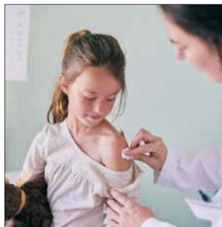
Las vacunas salvan cada año entre dos y tres millones de vidas en el mundo.

Europa es también el destino de más del 70% de las inversiones en I+D de estas compañías, que dedican más de 2.000 millones de euros anuales a escala global (datos del año 2014) a investigar y desarrollar nuevas vacunas, en el marco de un proceso cada vez más costoso. "Sabemos que desarrollar la