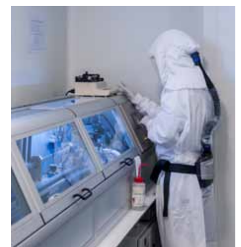
Trabajadora de iVascular en la zona de recubrimiento del balón con fármaco.

una compañía que cuenta con dos centenares de empleados, la gran mayoría -el 72%-, mujeres. En los últimos cinco años, iVascular ha crecido principalmente en Latinoamérica y en Oriente Medio y, en la actualidad, la empresa está estratégicamente centrada en incrementar su presencia en Asia, en especial en Japón, así como en Estados Unidos, sede de sus grandes competidores.