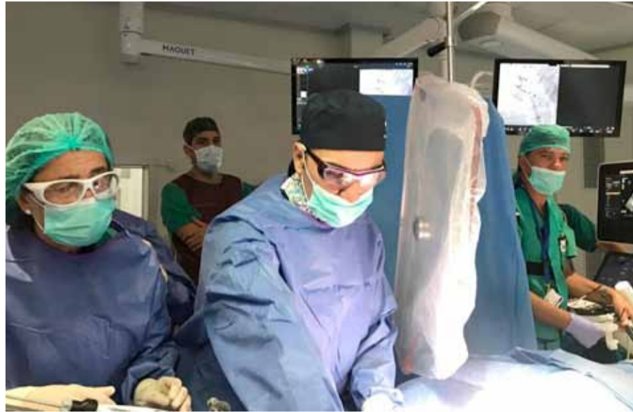
Equipo del Hospital Ramón y Cajal en la primera intervención en España con Cardioband.

En cuanto a la incidencia de esta enfermedad, cabe tener en cuenta que se clasifica según su nivel de severidad, pudiendo ser leve, moderada o severa. "Un estudio reciente realizado en 35.000 pacientes que se sometieron a una ecocardiografía puso de manifiesto que el 6% tenía por lo menos insuficiencia tricúspide moderada o severa, por lo que se puede decir que esta