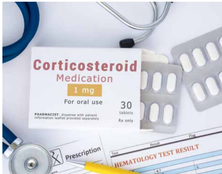
Los corticosteroides son fármacos derivados del cortisol.

Las cataratas producidas por el uso prolongado de corticoides tienen